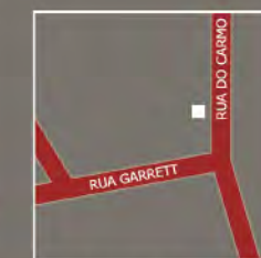
Espaço Santa Casa Rua do Carmo 17-21 - Lisboa