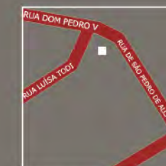
Igreja do Instituto de São Pedro de Alcântara Rua Luisa Todt, 1 - Lisboa