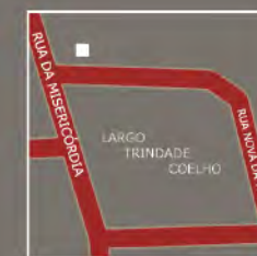
Igreja e Museu de São Roque Largo Trindade Coelho - Lisboa